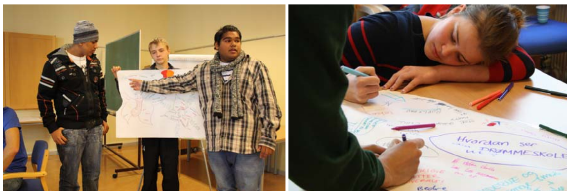
Foto: Deltakere på høringen